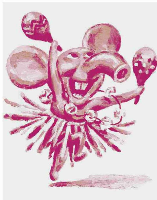
Alcune immagini per lasciare libera l'immaginazione